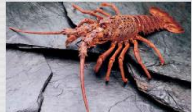
Langosta de Juan Fernández