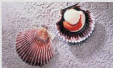
Ostión del norte