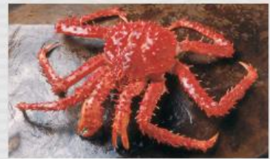
Centolla del sur